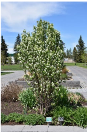
Amélanhier à feuille d'aulne

L'an dernier, nous avons acheté des plants de 4 catégories d'arbustes fruitiers. Nous n'avons pas pu les planter dans les différents parcs de la municipalité. Ils sont dans des pots et seront plantés ce printemps ou cet automne. Nous vous invitons à consulter le Contact Fleuri de 2021 pour la présentation plus complète de ces arbustes. Bien entendu, la récolte prend quelques années après la plantation. Lors de notre soirée Échanges vivaces, le conférencier invité vous entretiendra de ces arbustes entre autres.