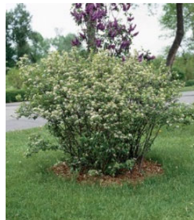
Aronie noire ( Aronia melanocarpa ) ( Amelanchier alnifolia )